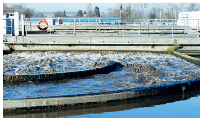
▲ Einsparungen von 40 % für Kläranlagen sind realisierbar.

Für die Entwässerung von Schlamm in Filter- und Siebandpressen gibt es nichts Besseres als die dynamischen Inline-Mischer von MPT. Durch die Gabe höher konzentrierter Flockungsmittel wird weniger Wasser zugeführt. Das senkt den Verbrauch. Und das Beste daran: je schlammiger das Durchflussmedium, desto besser der Vermischungsgrad!