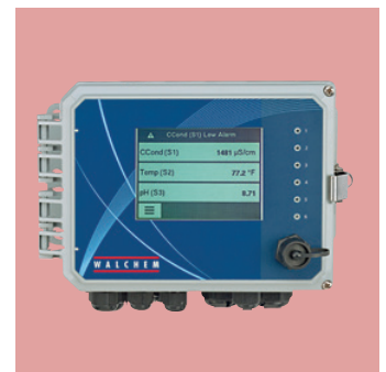
▲ W600: Zuverlässigkeit und Flexibilität für die Wasserkonditionierung.