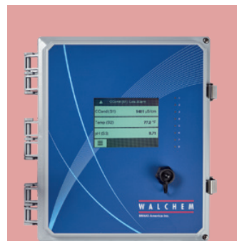
▲ W900: beispiellose Vielseitigkeit in der Wasseraufbereitung.