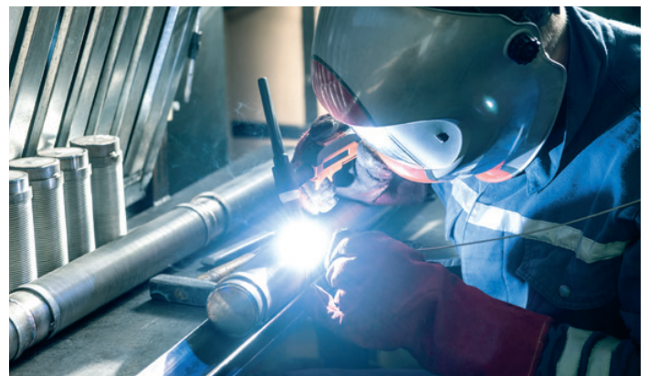
▲ MPT-Engineering heißt: Planen und Bauen aus einer Hand.

MPT ist seit Jahrzehnten mit der individuellen, spezifikationsbasierten Planung und Ausführung von Systemen vertraut. Rund um das Dosieren, Regeln und Mischen macht uns niemand etwas vor.