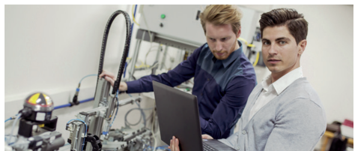
▶ Engineering von Anfang an: bereits im Angebotsstadium.

Unsere Projektleiter arbeiten eigenverantwortlich und eng mit den Kunden zusammen. Abstimmungen erfolgen auf kurzem Weg; Verlässlichkeit und Flexibilität zeichnen uns aus.