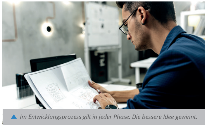
▲ Im Entwicklungsprozess gilt in jeder Phase: Die bessere Idee gewinnt.

Denn in jeder Phase des Entwicklungsprozesses leben wir die Maxime: Verbesserungen haben Vorrang. So fließen bessere Ideen auch im fortgeschrittenen Stadium noch ein.