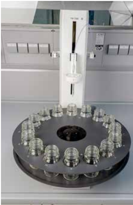
TW7200 mit Teller TZ4058 für 100 ml Laborflaschen VZ7081

Ein gutes Beispiel für die Automatisierung ist die Probenvorbereitung für die Viskosimetrie. Bei der Viskosimetrie von Polymerlösungen muss vor der Messung zunächst die Probenlösung mit einer vorgegebenen Konzentration hergestellt werden. Als Alternative zu Messkolben und sehr genauer Einwaage bietet sich für eine weitere Automatisierung und Vereinfachung die Kolbenbürette TITRONIC® 500 (mit Wechseinheit WA 50V für hochaggressive und viskose Lösungen) zusammen mit dem Probenwechsler TW7200 an.