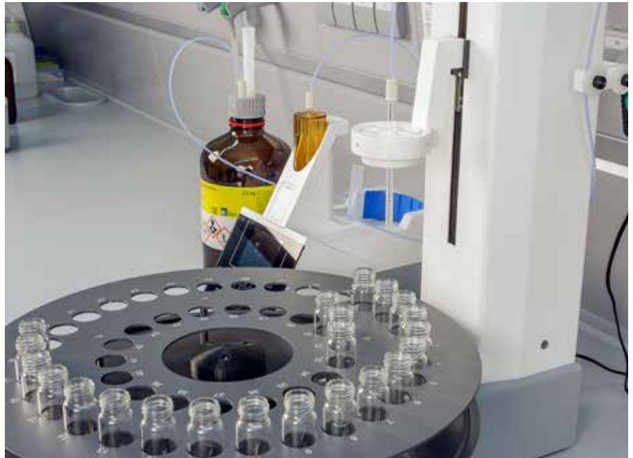
Probenteller TZ4050 für Probenflaschen VZ7088