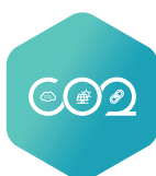
CO 2 Bilanzierung