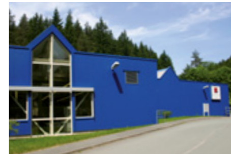
Werk 2 – Mellenbach Elektronikfertigung

Facility 1 – Mellenbach Administration and Development