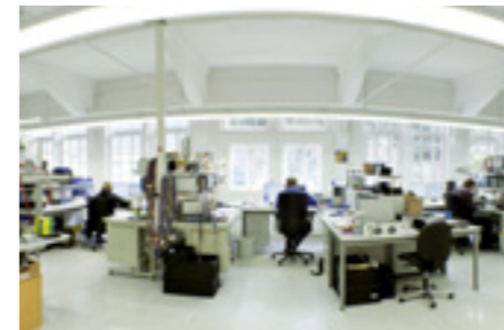
Entwicklungsabteilung R&D Department