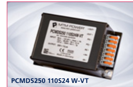
PCMDS250 110S24 W-VT