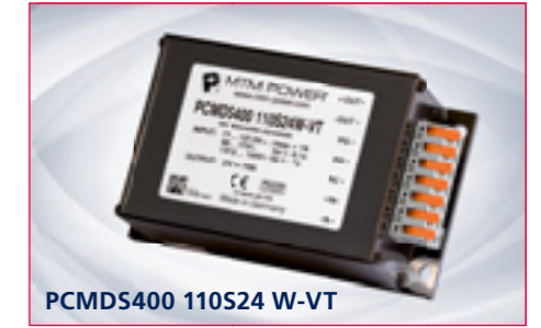
PCMDS400 110S24 W-VT