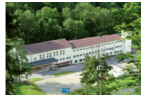
Werk 3 – Unterweißbach Transformatorbau

Facility 2 – Mellenbach Electronic Power Supplies Production