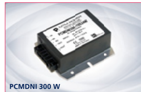
PCMDNI 300 W