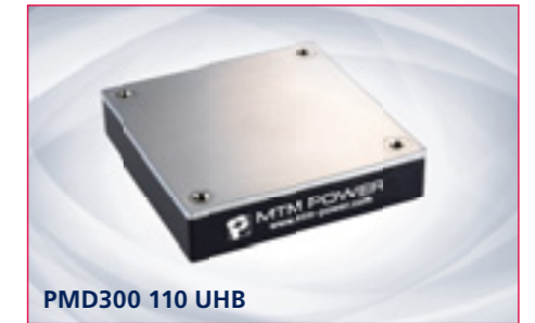
PMD300 110 UHB