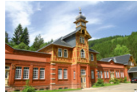
Werk 1 – Mellenbach Verwaltung und Entwicklung

Facility 1 – Mellenbach Administration and Development