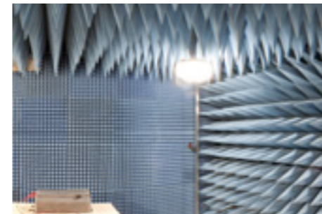
EMV-Labor EMC Laboratory