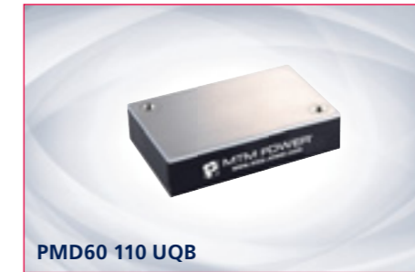
PMD60 110 UQB