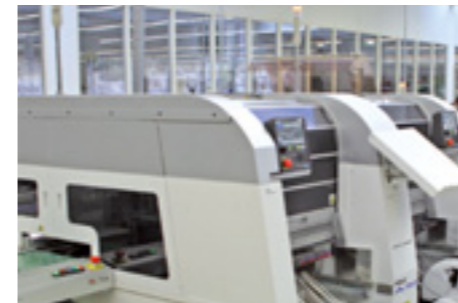
Fertigungshalle Production Hall