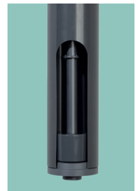
▲ Schwimmerschalter mit Wechselkontakten