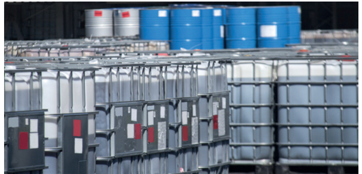
▲ Die MPT Sauglanze ist ein unverzichtbares Hilfsmittel für das reibungslose Chemikalienhandling

„ Wir haben nicht nur große Anlagen im Blick. Oft sind es kleine Komponenten, in denen unser Know-how und unsere Erfahrung zu Innovationssprüngen führen.“