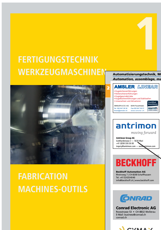
Table des matières bilingue (allemand/français).